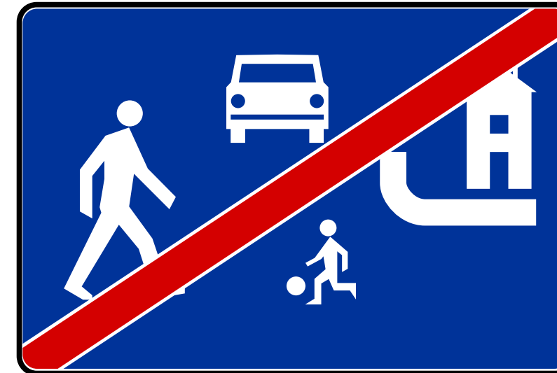
KONIEC STREFY ZAMIESZKANIA