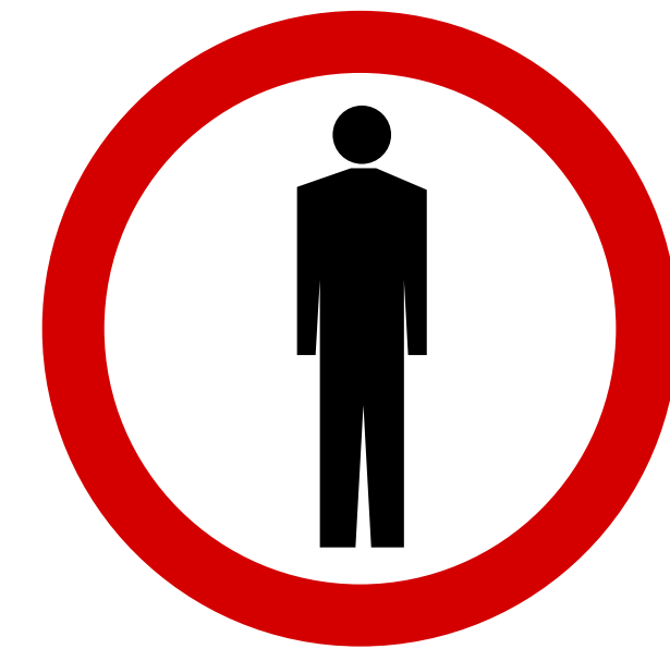
ZAKAZ RUCHU PIESZYCH