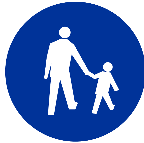
DROGA DLA PIESZYCH