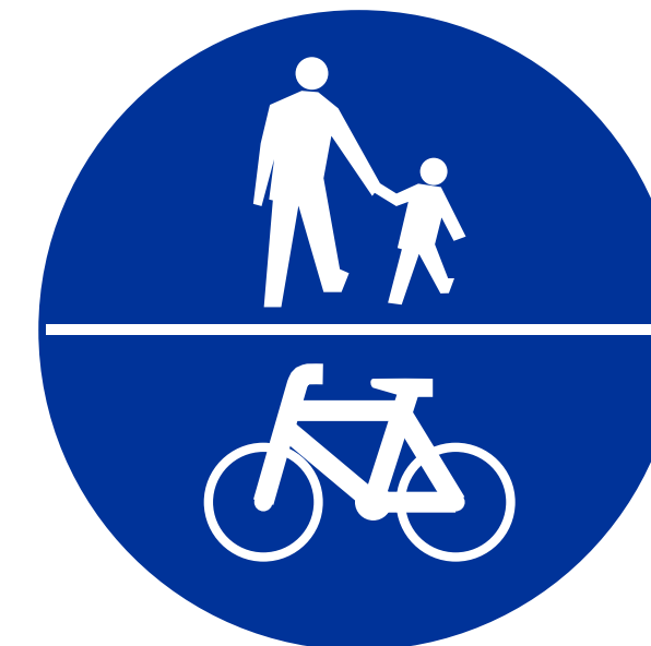
DROGA DLA ROWERÓW I PIESZYCH