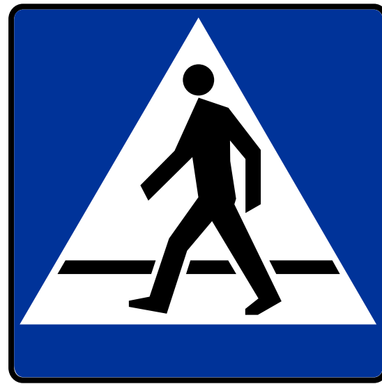
PRZEJŚCIE DLA PIESZYCH